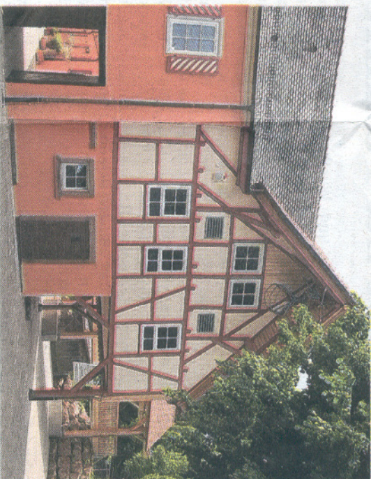
Das kann sich sehen lassen...

Was Dank dieser Energieleistung geschaffen wurde, kann vor allem beim Schloss- und Museumstest am Sonntag, den 14. September, bestaunt werden, wo die Besucher ab 10.30 Uhr im und um das Wasserschloss ein reichhaltiges Rahmenprogramm mit kulturellen und historischen landwirtschaftlichen und handwerklichen Vorführungen erwartet.