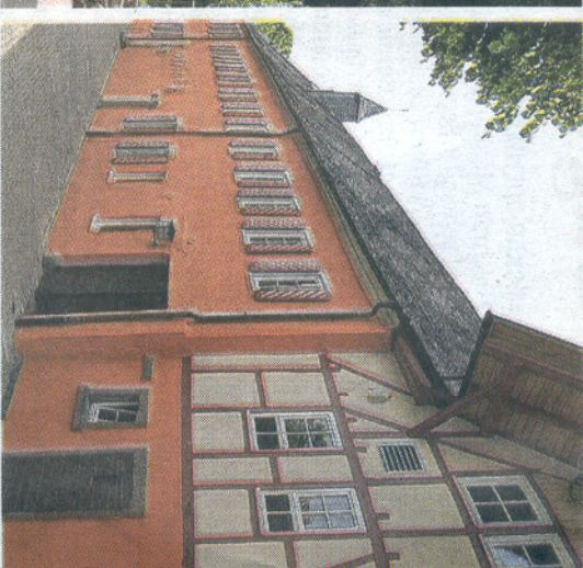
...was die Bürger geleistet haben.